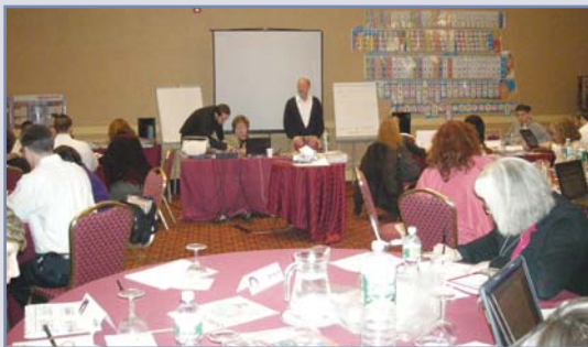
מכון תל עם למנהיגות חינוכית, ניו ג'רזי The TaL AM School Leadership Institute, New Jersey

For additional information please visit our website www.talam.org or send us an e-mail talam@talam.org