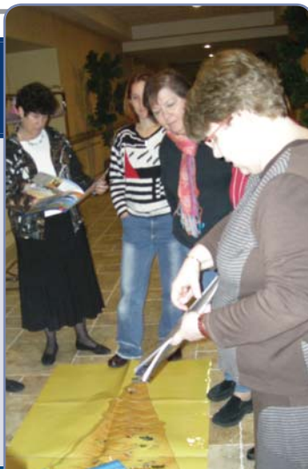
הוראת יחידת ישראל במכון תל עם ג, ניו ג'רזי Instruction of the Israel unit at the TaL AM 3 Institute, New Jersey