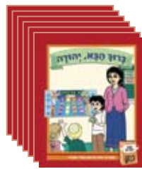
18 ספרוני ספריה 18 library books