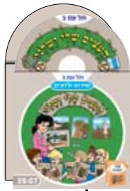
2 תקליטורים 2 CDs