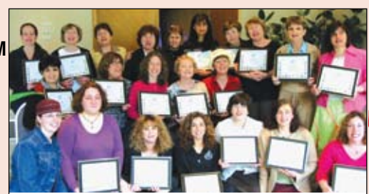
המורות המנסות של תל עם ג' במכון המסכם, מונטריאול, אייר תשס"ה Grade 3 Pilot testing teachers at the TaL AM Summative Institute, Montreal, May 2005

The TaL AM team is currently working on rewriting TaL AM for Grade 3 . We would like to thank our pilot testing teachers, whose experience and input helped improve the new program.