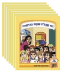
7 ספרוני ספריה 7 library books