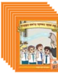
7 ספרוני ספריה 7 library books