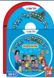
2 תקליטורים 2 CDs