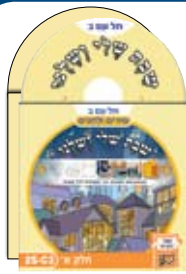
2 תקליטורים 2 CDs

למרות האתגר הראשוני והעיכובים במשלוח, אנחנו מקבלים משוב נלהב מצד מורים ותלמידים על חומרי הלימוד השונים. להלן מבחר חומרים שהתפרסמו בחודשים האחרונים: