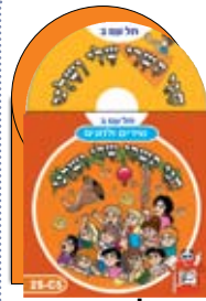
2 תקליטורים 2 CDs